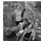
TRIO LES DEJANTES

Le spectacle 100% twist'nd rock ! De Johnny Hallyday aux Beatles, des Rolling Stones aux Kinks... Deux heures très « show » arrosées d'humour.